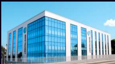
JDentalCare Training Center Via Dino Campana 2, 41123, Módena