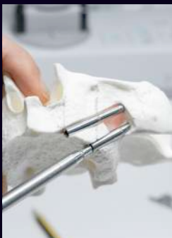
SESIONES PRÁCTICA CIGOMÁTICOS