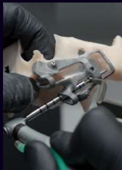
SESIONES PRÁCTICA Z-GO GUIDE™