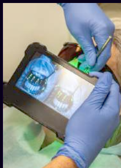
SESIONES PRÁCTICA FOTOGRAMETRÍA