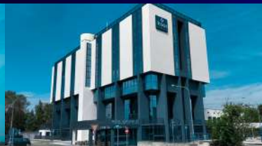
RMH Modena Raffaello Hotel Strada Cognito 5, 41126, Módena