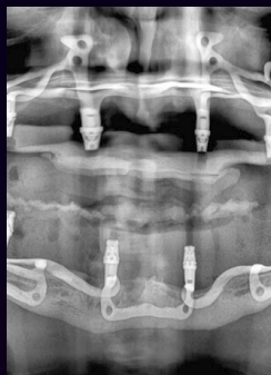
SESIONES PRÁCTICA IUXTA