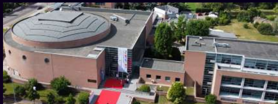
Forum Monzani Centro Congressi Via Aristotele 33, 41126, Módena El 20 de junio, a partir de las 19:00, quédate con nosotros para el Aperitivo JD