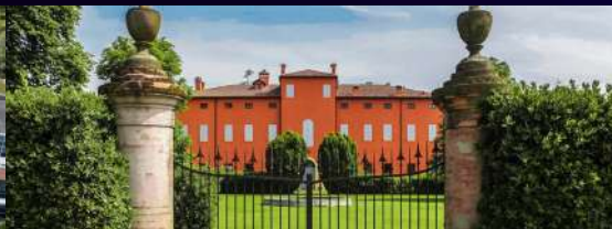
Villa Forni Strada Piradello 106, 41126, Cognito (MO) El sábado 21 de junio, a partir de las 20:30, quedas invitado a la Cena de Gala