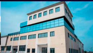
JD Milling Center Via Guido Cavani 69, 41123, Módena